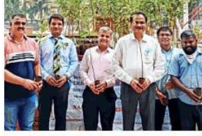
सहकार्य लाभलें. तसंच विद्यार्थी या उपक्रमात सहभागी झाले होते. या अगोदरही 'इको ब्रिक्स' या अनोख्या

एस. एम. शेट्टी कॉलेजचा अभिनव उपक्रम 'माझी वसुंधरा' अभियानाला चालना